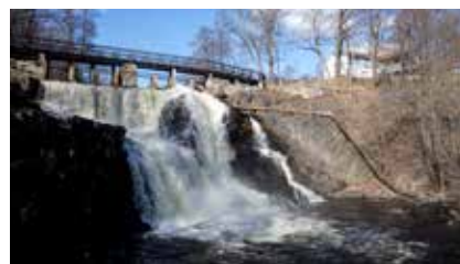
Her ved Granfos i 1221 sloss Kong Håkon Håkonsen med opprørgjengen Ribbungene ved Granfos, og jaget dem vestover mot Sandvika.

For at mennesker skal trives, må man ha røtter dypt ned i landskapet man bor i. Livet blir først fullverdig når man har en fremtid – og en fortid. Kunnskap om fortiden gir retning for fremtiden. En film om Stabekk vil derfor ha betydning for alle som bor her. Like viktig akkurat nå er at entreprenører og beslutningstagerne i kommunen og staten også får en dypere forståelse av hva som er unikt med dette stedet. Vi bor i et levende museum.