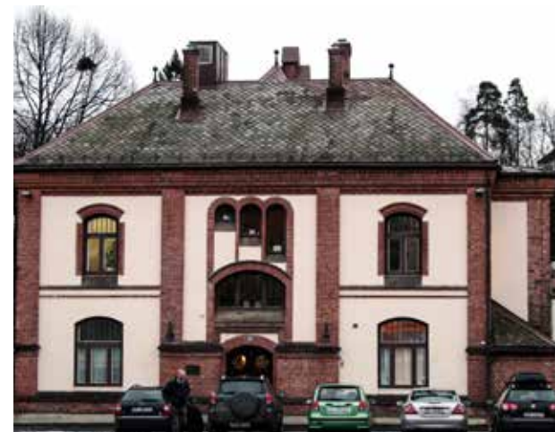
Stasjonsbygningen i dag, tegnet av Paul Due.

Stabæk Landhandleri står ferdig 1909, og på det lille torget ventet bussen mot Lommedalen, populært