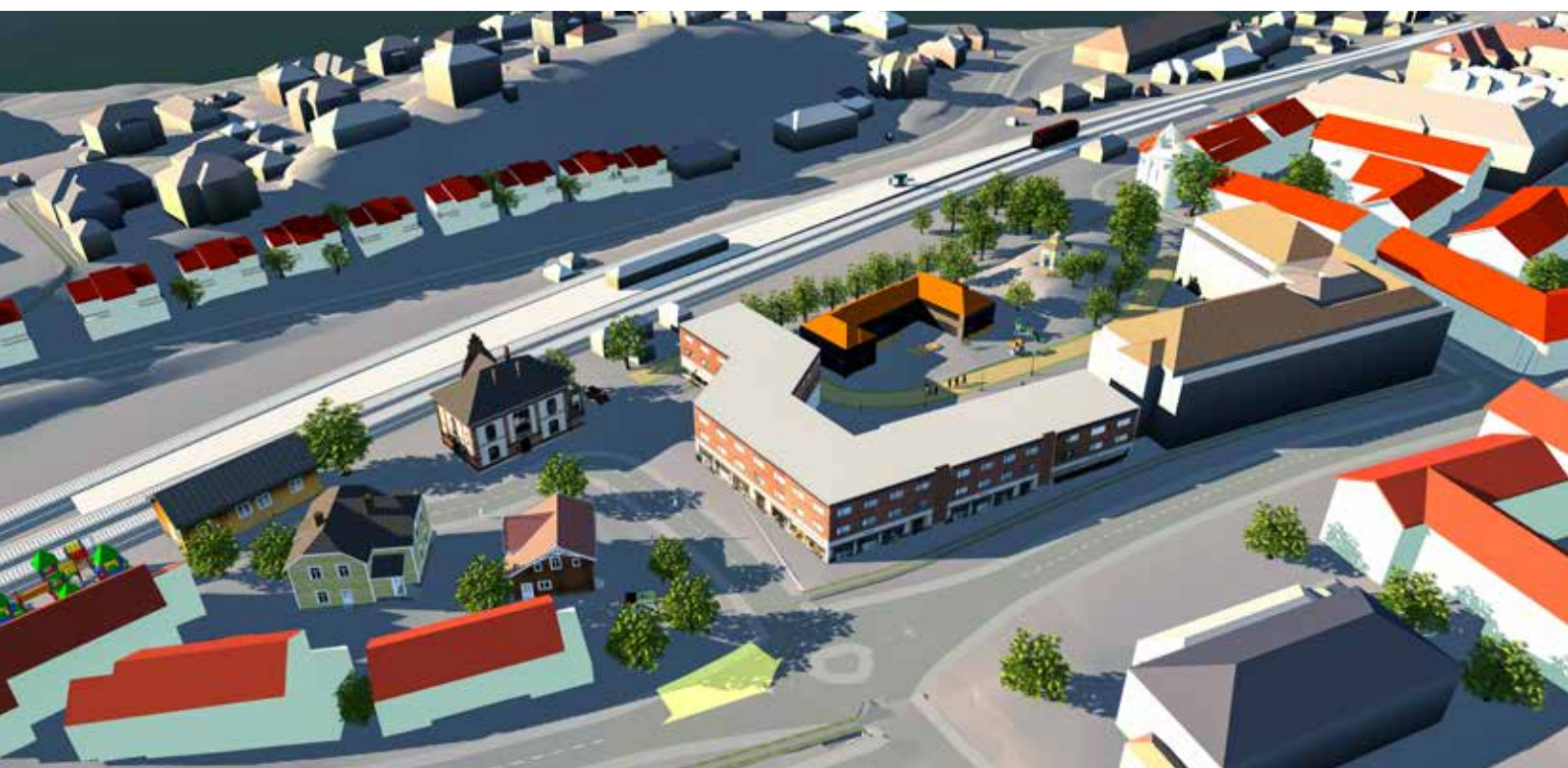
Fra VSVs modell: Stasjonstunet til venstre - våre forlag til nye hus er hvite med lyserøde tak

Det hyggelige er at flertallet i Fylkesutvalget i Akershus - selveste formannskapet i fylket - med FrP is spissen, er enige med Vestre Stabekk Vel om at hele stasjonstunet bør bevares. Dette vedtok de 6. juni 2016, og fylket stod fast på bevaring av dette viktige kulturminnet senest i desember 2018, da Bærums administrasjon enda en gang bad om å få rive. VSV kjemper ennå for at vi kan få gjennomført plansmie basert på urbant jordskifte. Og innen dette blir realisert, regner vi med at den midlertidige feberen etter å bygge i høyden på selve knutepunktet vil gi seg - og at miljøpolitikken igjen vil handle om å la folk få bo nær bakken med gress og trær, i hus med menneskelige proposjoner.