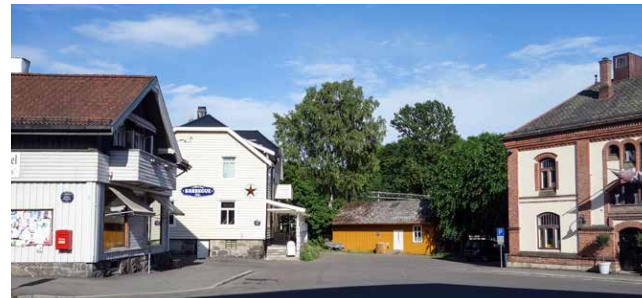
Stasjonstunet 100 år etter - i 2018. Stasjonshuset av Paul Armin Due (1903) til høyre.

I 1909 bygget man landhandel på stasjonen, til glede for alle passasjerer som skulle opp med parafinlykter langs de gjørmete stiene i åsene rundt stasjonen