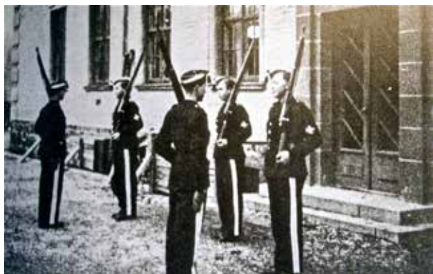
Quislings hird venter utenfor Jar skole, mens Føreren arresterer lærerne.

punkt, steg Quisling igjen opp på bordet og uttalte: «Dere hadde sjansen, mine herrer. Nu er det for sent. For sent... Forferdelige ord!» Hvorpå han arresterte dem alle. Lektorene ble kjørt bort på lastebiler og forble fengslet på Storo Fangeleir til krigen var over.