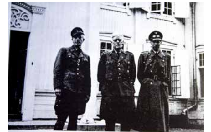
Fra venstre: Quislings justisminister Risnæs, og politiminister Jonas Lie og sjef for det forhatte statspolitiet, Henrik Rogstad, noen få timer før de to til høyre dør for egen hånd.

Nord på Stabekk, på gården Skallum, flytter rikspolitipresident Jonas Lie jr. inn under krigen. En av de siste krigshandlinger i Europa på slutten av 2. verdenskrig, er hjemmefrontens beleiring av Skallum som ender med politiminister Jonas Lies og statspolitijef Rogdes dramatiske selvmord og justisminister Risnæs innledning av tyve års skuespill som sinnssyk på Reitgjerdet. Et skuespill som først ender da han som gammel mann får konstatert kreft og ringer NRK for å tilby dem intervju om det indre liv i Quislings regjering. Quisling selv har også en viktig rolle i vår historie. Stabekk Gymnas, grunnlagt 1923 av den radikale