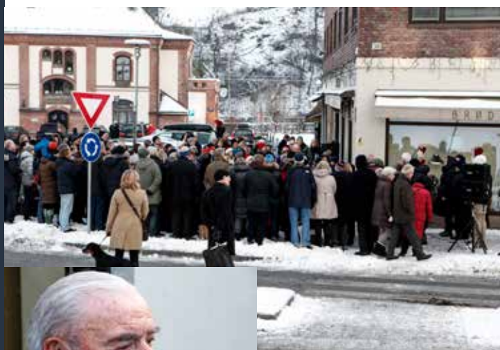
Befolkningen samlet seg da Jo Benkow i 2010 avduker minneplaten på barndomshjemmet Stabekk-huset.