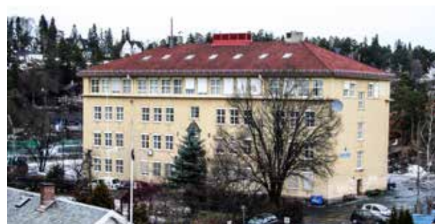
Stabekk Gymnas - får det fortsatt ligge på Stabekk?