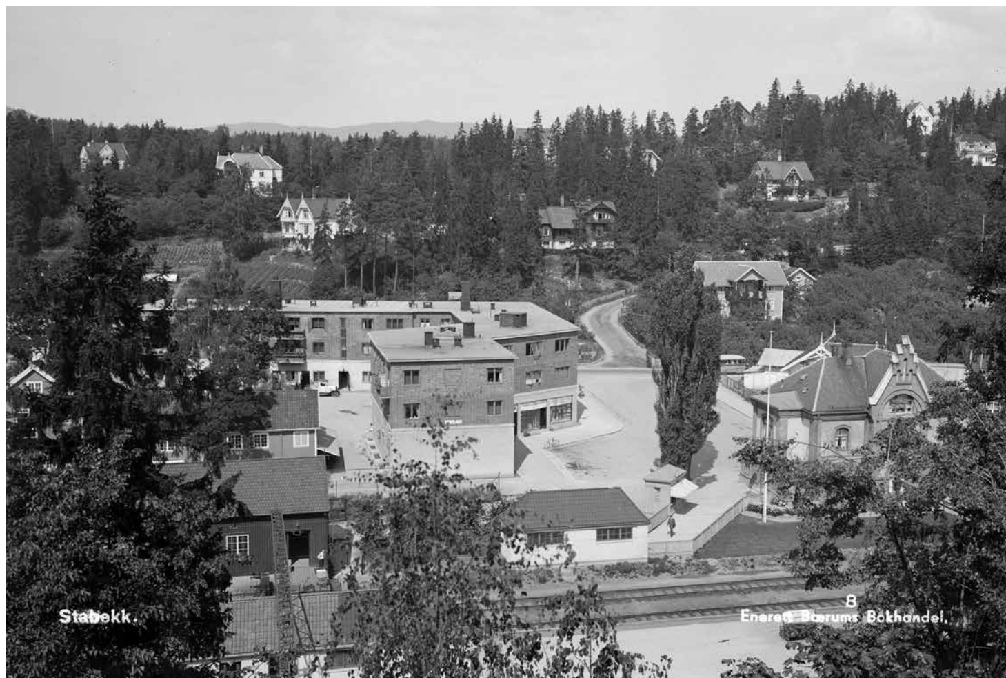
Stabekkhuset og stasjonen.