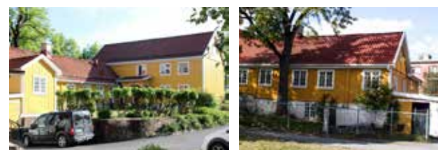
Østre Stabekk Gård.

Den til høyre gikk nordover mot Bergen via Krokskogen og Ringerike. Østre Stabekk gård ligger rett før krysset og blir en viktig skyss-stasjon, med berømte og godhjerta Mor Stabekk bak vaffeljernet. Så viktig blir gården at Norges første statsminister,